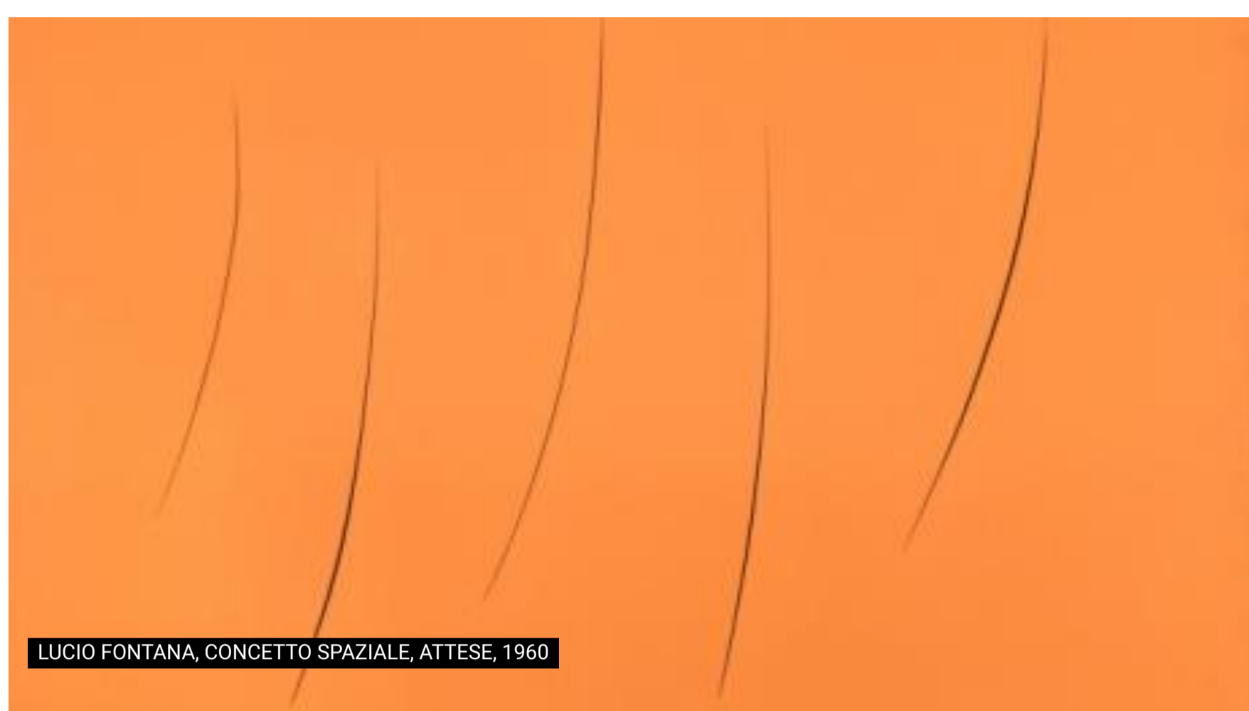
LUCIO FONTANA, CONCETTO SPAZIALE, ATTESE, 1960

Dal 27 ottobre 2022 al 28 gennaio 2023 la galleria Building di Milano presenta la mostra Il Numinoso a cura di Giorgio Verzotti , un progetto espositivo che indaga il senso del sacro nell'arte contemporanea .