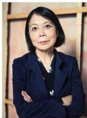
Sopra, Leiko Ikemura © María Rúnarsdóttir Sotto, «CRN Act» di Leiko Ikemura