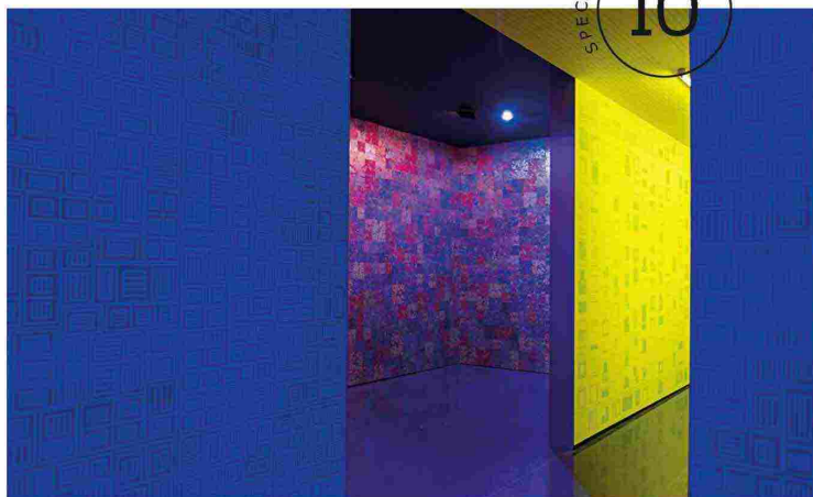
New York New York , Peter Halley, 2018, Lever House, New York, USA.